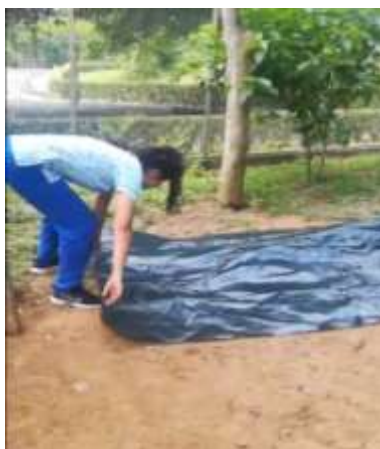
Ilustración 2 Plásticos colocados sobre la superficie del suelo de jaulas de exhibición